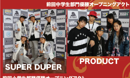
前回中学生部門優勝オープニングアクト