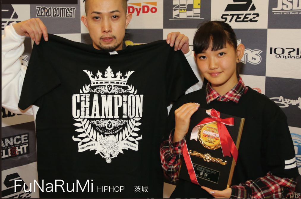
FuNaRuMi HIPHOP 茨城