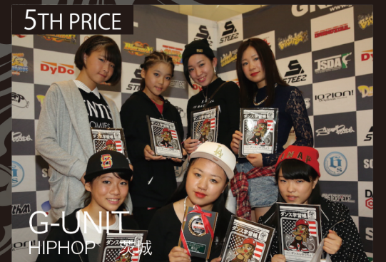
G-UNIT HIPHOP 茨城