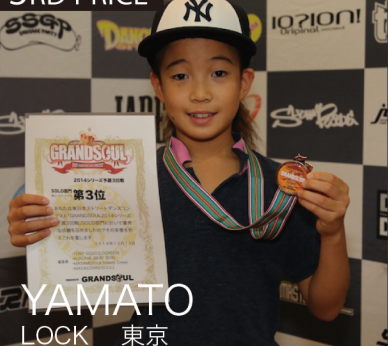
YAMATO LOCK 東京