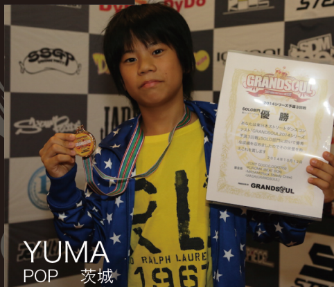
YUMA POP 茨城