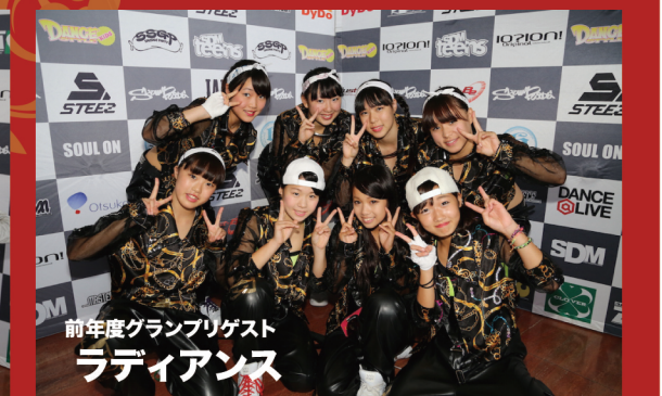
前年度グランプリゲスト