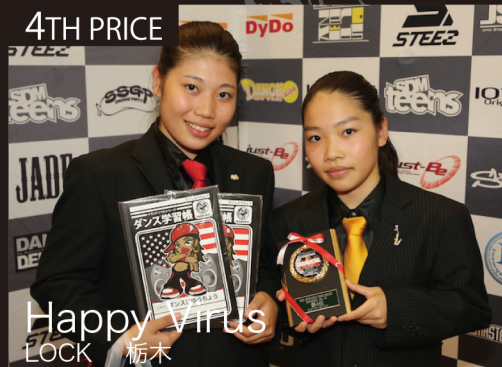
Happy Virus LOCK 栃木