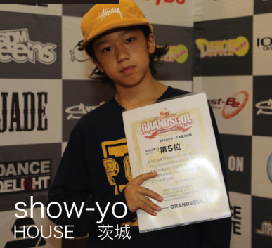
show-yo HOUSE 茨城