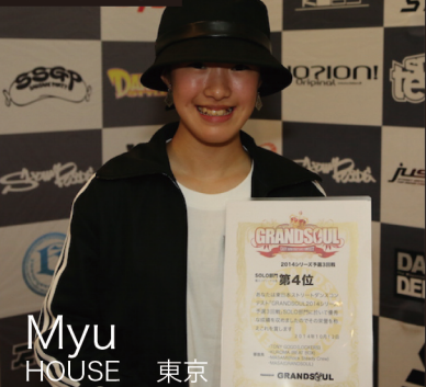
Myu HOUSE 東京