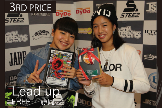
Lead up FREE 静岡