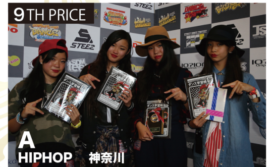
前回小学生部門優勝オープニングアクト