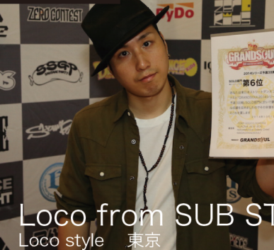
Loco from SUB STREET Loco style 東京