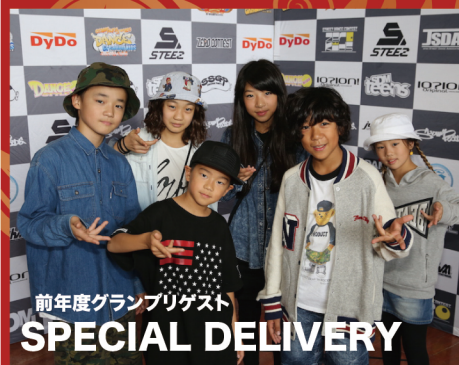
前年度グランプリゲスト