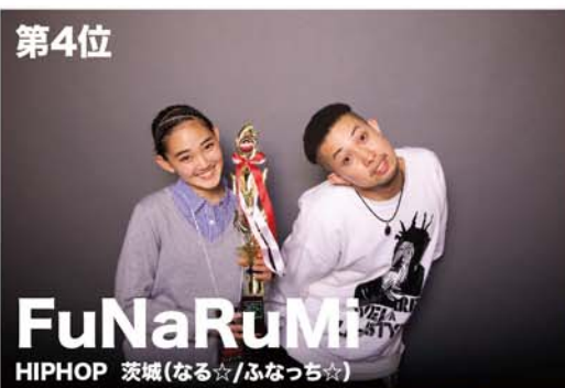
FuNaRuMi HIPHOP 茨城 (なる☆/ふなっ☆)