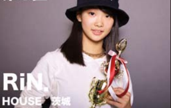
RiN HOUSE 茨城