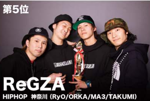
ReGZA HIPHOP 神奈川 (RyO/ORKA/MA3/TAKUMI)