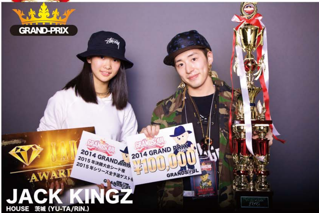
JACK KINGZ HOUSE 茨城 (YU-TA/RIN.)