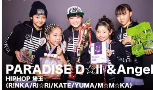
PARADISE D☆ll & Angel HIPHOP 埼玉 (RINKA/Ri☆Ri/KATE/YUMA/M☆M☆KA)