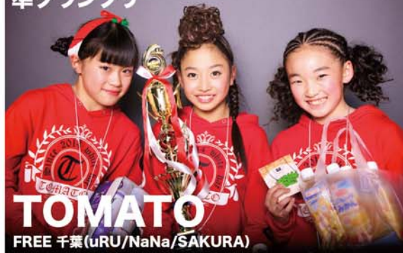
TOMATO FREE 千葉 (uRU/NaNa/SAKURA)