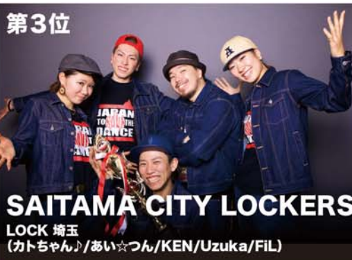
SAITAMA CITY LOCKERS LOCK 埼玉 (カトちゃん♪/あい☆つん/KEN/Uzuka/FIL)