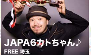
JAPA6カトちゃん FREE 埼玉