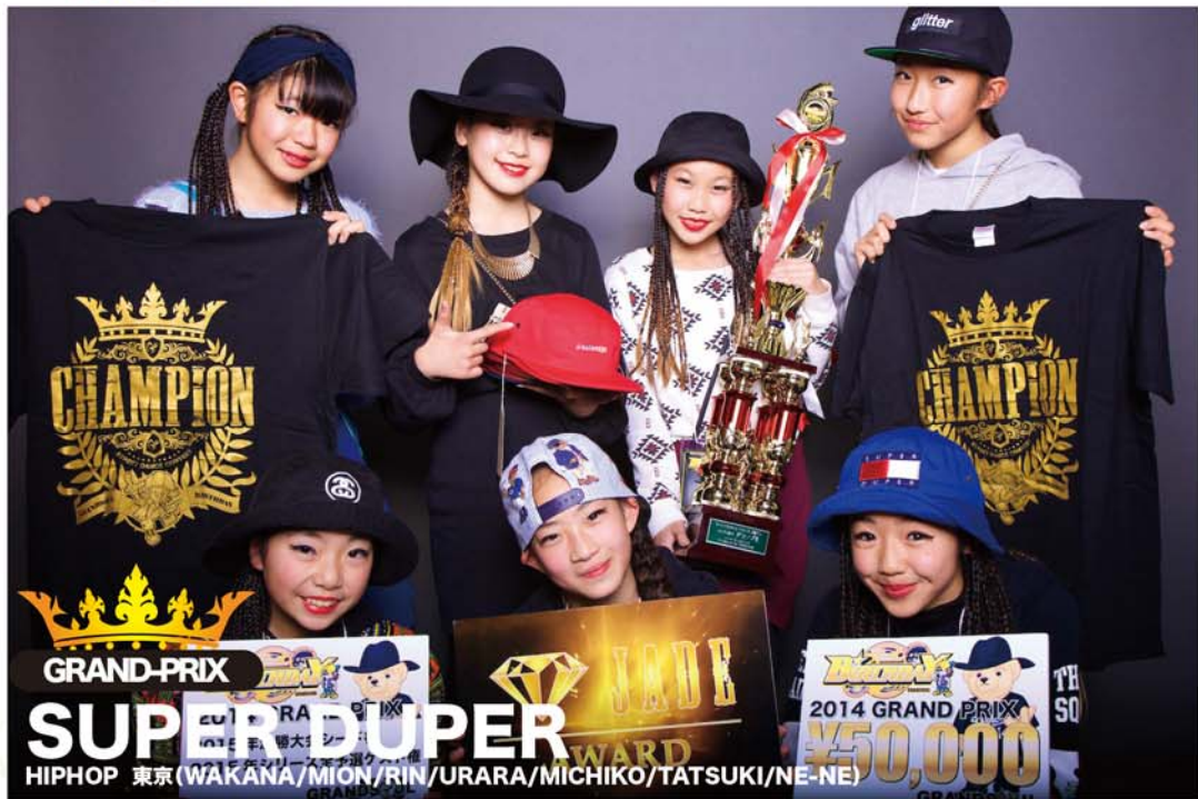
GRAND-PRIX SUPER DUPER AWARD HIPHOP 東京 (WAKANA/MION/RIN/URARA/MICHIKO/TATSUKI/NE-NE)