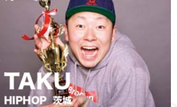
TAKU HIPHOP 茨城