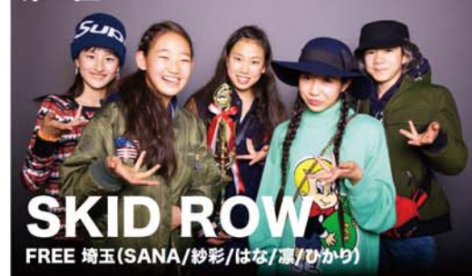
SKID ROW FREE 埼玉 (SANA/紗彩/はな/凜/ひかり)