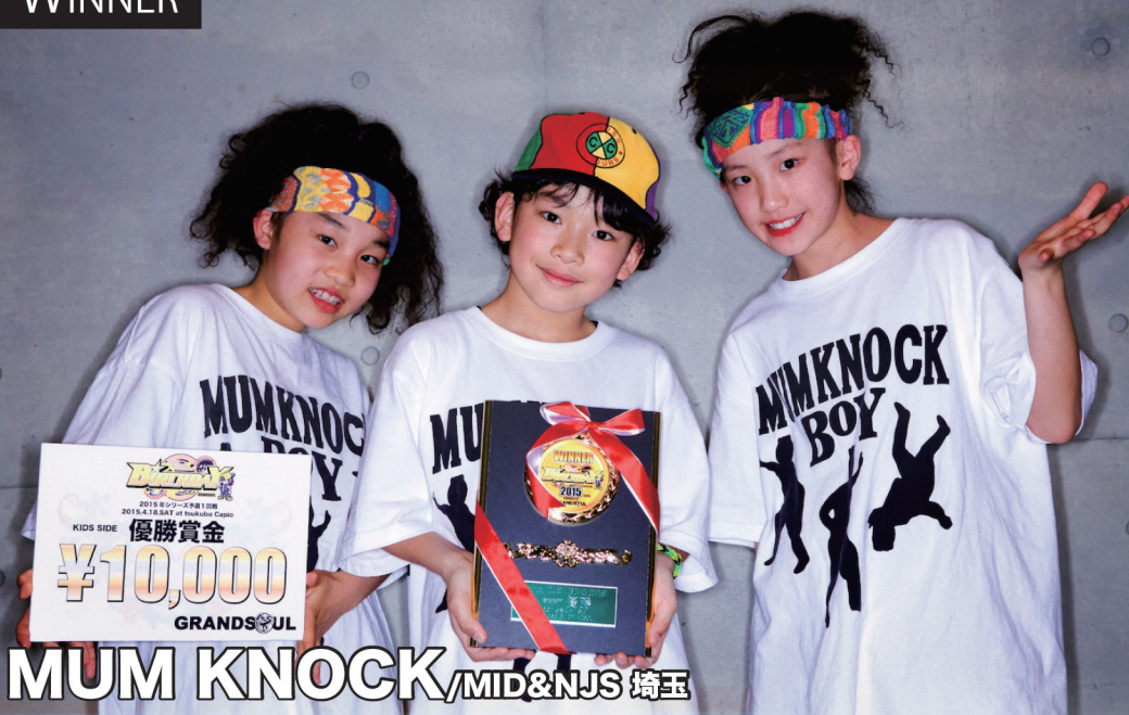
MUM KNOCK/MID&NJS 埼玉