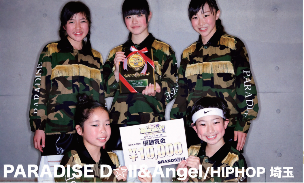
PARADISE D☆it & Angel/HIPHOP 埼玉

①新メンバーになり、中学生部門で初めてのコンテストで優勝できたことが素直に嬉しいです！ありがとうございます。 ②アップする場所もあり、控え室も十分なスペースをご用意いただきありがとうございます。出番まで集中して練習できました！ ③当日まで衣装を縫っていました…移動の電車の中でもチクチク縫って、やっと完成した衣装での優勝！本当に嬉しかったです。 ④メンバーが新編成になり、衣装も新しくしました！何度も着てこの長さが何センチで…など話し合っ、イメージ通りの衣装が仕上がりました。とにかく見た目も踊りもカッコよく！誰が見てもカッコいいと思わせたい！いつも考えて踊っています。