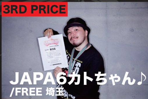
JAPA6カトちゃん /FREE 埼玉

嬉しいです! チームとソロの2部門出たのでどちらもがんばりました! ソロは全力で駆け抜けたかったのですがラスト足が地に着かなくてよけてしまい、まだ自分のイメージに近いダンスは出来て無いなど感じたので決勝までに鍛え直します! 【音との遊び】それが自分が目指す! 自称【アミューズメントスタイル】です、目指すは魅せたい踊りで優勝!