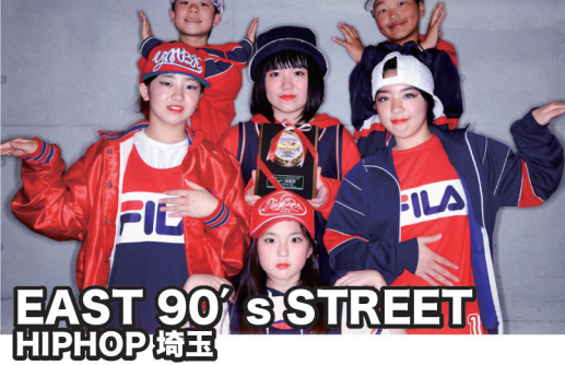
EAST 90'S STREET HIPHOP 埼玉

①嬉しいです。頑張ってきたのももちろん、自分達が好きなスタイル、こだわりが評価された気がして本当に嬉しかったです。 ②有名なコンテストだし、大きな会場だし、出場する皆さん上手い人たくさんいるしではじめ緊張しましたが、会場の雰囲気を楽しみ感じだったので楽しんでやれました！ ③会場には車にみんなで乗っていきました。途中サービスエリアで焼き鳥食べたりして旅行気分でした！そして会場に着いたら一気に緊張しました 笑 ④テーマはハッキリしていたので、衣装も音楽もテーマにハマってる感じにしました。あと、衣装バラバラだけど統一感が見えるように考えたりそれぞれの個性がプラスに働くような構成にしました。 ⑤いろんなコンテストに挑戦していきたいと思っています。